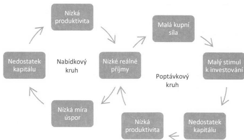
Obr. 2: Začarované kruhy chudoby podle R. Nurkseho

různě měnili posloupanost jednotlivých článků kruhu. Mezi nejvýznamnější patří koncepce nabídkového a poptávkového kruhu R. Nurkseho (viz obr. 2).